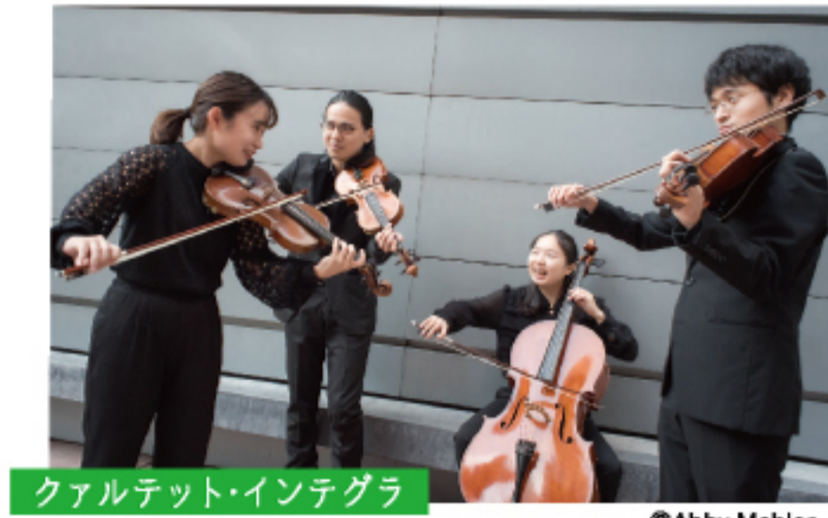
カルテット・インテグラ