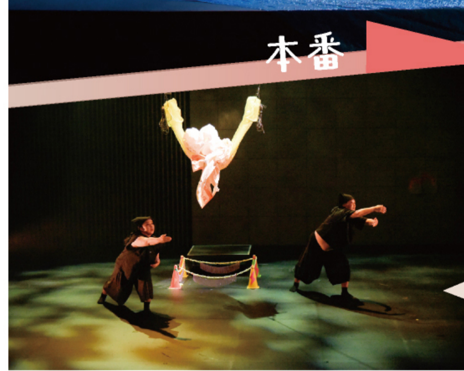
舞台写真