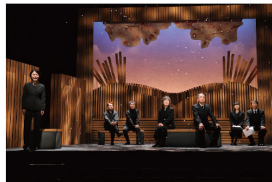
第49回公演『七人の墓友』舞台写真

K3/15(土) Q3/22(土) 一般発売 3/23(日) ラッパ屋 第50回公演 「はなしづか」 笑えて泣けてほろ苦い、大人の喜劇 4/27(日) 14:00 中劇場 [作・演出] 鈴木聡 [出演] 春風亭昇太、柳家喬太郎、ラサール石井/ おかやまはじめ、俵木藤汰、岩橋道子、弘中麻紀 大草理乙子、岩本淳、中野順一郎、浦川拓海 宇納佑、熊川隆一、武藤直樹 / ともさと衣、椎名慧都、松村武 [料金] 一般¥5500、ティーンズ(13～19歳)¥1500