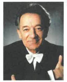
芸術監督・首席指揮者：ユリー・テミルカーノフ

でも新しいファンを増やしている伝説的な指揮者エゲニムラヴィンスキーのもとで、シヨスタコーヴィチの重要な作品をいくつも初演し、国内外で何度も演奏をしてきているのですから。