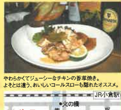
やわらかくてジューシーなチキンの香草焼き。よそとは違う、おいしいコースローも隠れたオススメ。

リバーウォーク北九州の勝元・室町界隈、常盤橋（木の橋）近くのカカポコロニーは、木に囲まれてゆったりとした雰囲気、洋酒を中心としているなお酒が揃っています。パスタやオムレツなど、観劇後の空腹もしっかり満たしてくれるメニューも多く、帰りの時間に余裕があればぜひ立ち寄っていただきたいところ。本誌持参で「本日のキッシュ」のオマケあり（次号発行まで）。