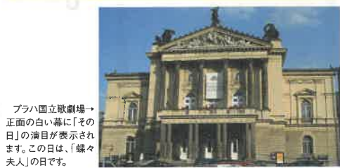
プラハ国立歌劇場→正面の白い幕に「その日」の演目が表示されます。この日は、「蝶々夫人」の日です。