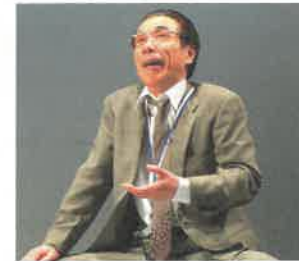
写真は公演内容とは関係ありません。

好評発売中 チケットぴあ・Pコード●368-166 ローソンチケット・Lコード●86064