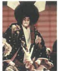
「菅原伝授手習鑑」寺子屋の段より

【昼公演】13:30 解説、「菅原伝授手習鑑」寺入りの段、寺子屋の段、「釣女」 【夜公演】18:00 解説、「菅根崎心中」生玉社前の段、天満屋の段、天神森の段 ●出演 (財)文楽協会 全席指定 S席¥3000 A席2000円