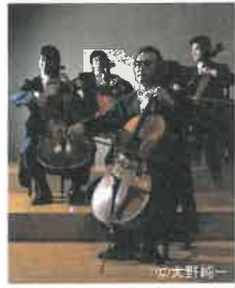
一期一会 究極のアンサンブルを心ゆくまでお楽しみ下さい。

ラ・クアルティエーナは、NHK交響楽団のチロ・セクションの精鋭4名によるアンサンブルです。日ごろ、オーケストラや室内楽、ソロ活動などで多忙な彼らが、このように全員揃うことは稀。コンサートの数も限られていますが、ひとたび開催されれば、チケットはすぐに完売という人気ぶり。CDもすべてが好評です。また、今回は、新進