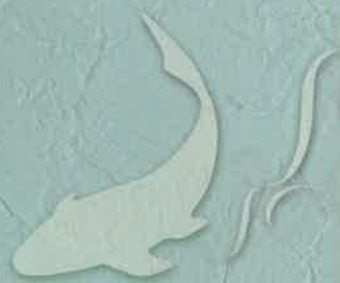
MONOによる「錦鯉」初演。劇団での土田氏は俳優でもあり、このときは赤屋組上部組織の組員を怪演(?)した。今回は作・演出に徹するが、自分が演じた役には手厳しくなるという噂も! ■00年6月 MONO第26回公演 中野ザ・ポケット