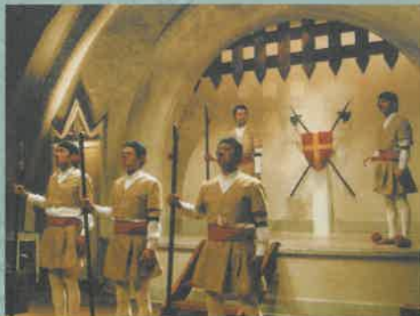
MONO前回の公演は第33回公演「衛兵たち、西高東低の鼻を擡ぐ」。土田氏の英国留学帰国後第2作で、拠点の京都でのみの公演だった。状況は不条理ながら、リアルさ満点の会話劇が思いこみと世間の可笑しさを生み評判となる。ちなみに、MONOの次回公演は07年3月に新作「地獄でござります」の北九州公演(北九州芸術劇場)も決まっている。