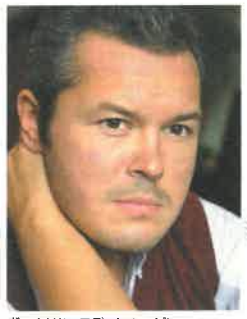
ヴァイオリン：ワディム・レーピン

今回の北九州公演では、そのシヨスタコーヴィチ作品が2曲。特に交響曲第5番は、前記の通りこのオーケストラが約70年前に初演しているだけに、「本場」という勲章を堂々と引かせる公演。音楽の「フレーズ」、1ハーモニーに確かな自信が感じられ、シヨスタコーヴィチの言葉が自然に音楽となっていくような演奏ができるのは、世界広しと言えどもこのオーケストラだけでしょう。またエゲニ・キーシン(ピアノ)と同じ時代に神童として登場したワディム・レーピンが、ヴァイオリン協奏曲第一番を演奏。作曲者の盟友だったヴァイオリニスト、ダヴィド・オイストラフが初演をした作品ですが、デビュー時に「オイストラフの再来」と絶賛されたレーピンだけに、こ