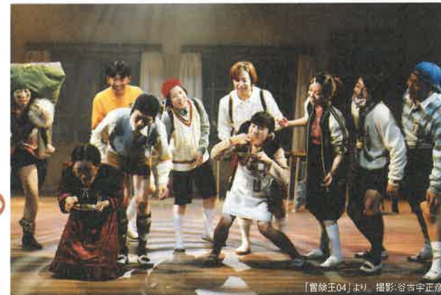
「冒険王07」より

2007 1/27(土)・28(日) 長崎公演もあり! 長崎ブリックホール 大ホール特設小劇場