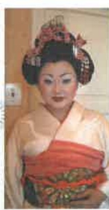
舞台メイクに注目！ 出演前、楽屋にて。

「自宅やウィーン国立歌劇場の練習室でのレッスン・光栄なことです。雰囲気ではなく、テクニクで歌うこと、技と心の関係の大切さを学びました。それだけではありません。年齢やキャリアに応じて変わる役柄や声についてもアドヴァイスを載せています。先生の経験談、指揮者も共演者のお話も勉強になりますね。」