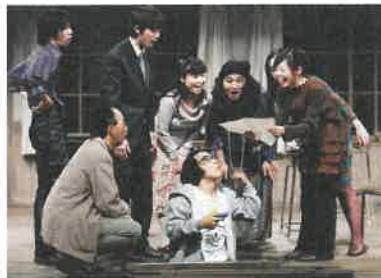
「冒険王04」より