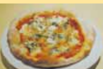
新鮮な水牛のモッツアレラチーズを贅沢に使った「ピッツァ・マルゲリータ」