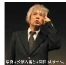
写真は公演内容とは関係ありません。

好評発売中 電子チケットぴあ・Pコード●377-592 ローソンチケット・Lコード●85458