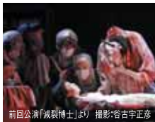
前公演「破綻博士」より

電子チケットぴあ・Pコード●377-603 ローソンチケット・Lコード●85466 劇場チケットクラブ会員先行予約日 電話予約 9/29(土) 11:00~18:00 引取期間:9/30~10/6