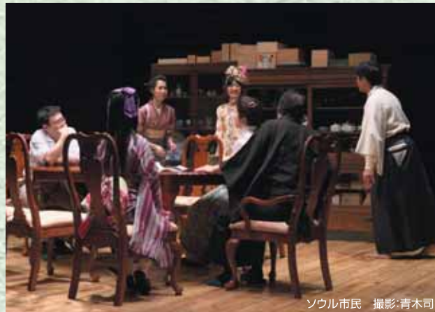
ソウル市民

は、やはり広く外の世界でも応用されるだけの普遍性を内在している。「ソウル市民」はその証のひとつであり、だからこそ成果が認められることが「際うれしい作品です。北九州の観客の方々にも、その成果の証人になつて頂ければ幸いです。