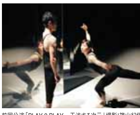
前回公演「PLAY 2 PLAY」—干渉する次元|撮影:篠山紀信

好評発売中 電子チケットびあ・Pコード●377-595 ローソンチケット・Lコード●85459