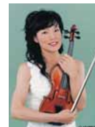
千住真理子(ヴァイオリン)

11月9日(金)よりチケット発売開始(予定) 11月6日(火) 響ホール友の会先行発売