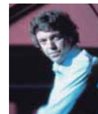
パスカル・ロジェ(ピアノ)

●出演 パスカール・ロジェ(ピアノ) ●曲目 フォーレ:夜想曲 第1番 変ホ短調 op.33 ドビュッシー:前奏曲集 第1巻 ラヴェル:ソナチネ ブーランケ:3つの小品 ほか 指定席¥4000 自由席一般¥3500 自由席学生¥1500(当日各¥500増) *1階はすべて指定席です。 2008年3/15(土) 15:00 12月7日(金)よりチケット発売開始(予定) 12月4日(火) 響ホール友の会先行発売