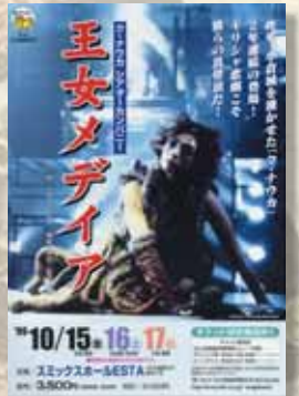
ク・ナウカ シアターカンパニー「王女メディア」チラシ。99年10月15～17日スミックスホールESTAにて上演。