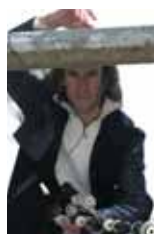
カルロス・ヌニェス(バグパイプ)

スペイン北部のカリシヤ地方。ケルト文化が色濃く残るこの地で、10年以上に渡り、その第一人者として限らない敬意を集める孤高のカリスマ・ミュージシャン、カルロス・ヌニェス。カリシヤン・バグパイプともいえる“ガイタ”と様々なホイッスルを自在に操る圧倒的なパフォーマンスは注目です。「ボレロ」といったクラシックから「ゲド戦記」「星になった少年」などの映画音楽まで活躍する彼の音色は、空や海・大地を連想させます。