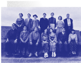
KERA-MAP #010「しびれ雲」 12/17(土)・18(日) 北九州芸術劇場中劇場にて上演 ※公演詳細は中巻 Stage Lineup 参照